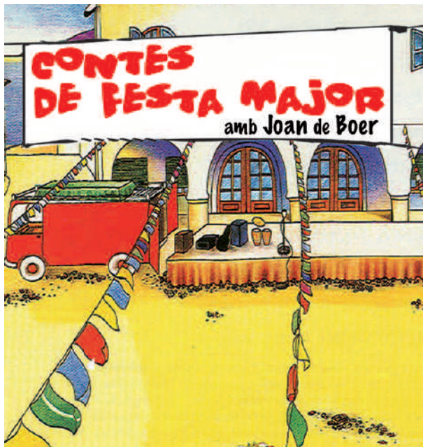
Contes de Festa major Diumenge a les 12 del migdia · Plaça dels Bosquerols