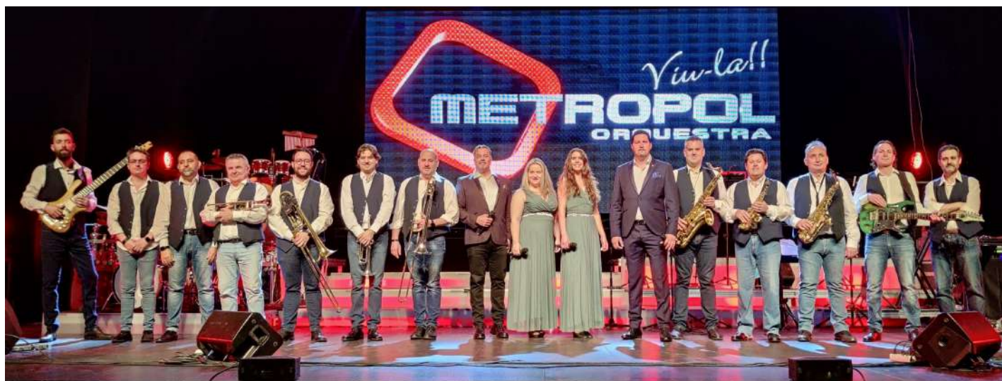
Gran concert de Festa Major i ball amb l'Orquestra Metropol Diumenge a les 7 de la tarda i a les 10 del vespre · Can Cassó