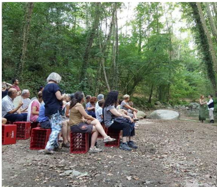
Fem Festa, Fem Montseny Diumenge a les 7 de la tarda · Museu Etnològic del Montseny